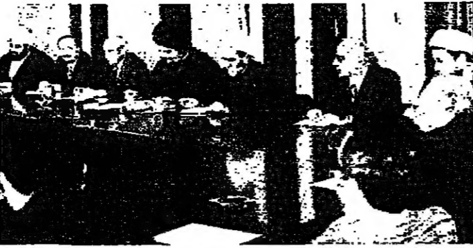
الاجتماع الشيعي يترأسه السيد موسى الصدر في المجلس الاسلامي الشيعي الاعلى